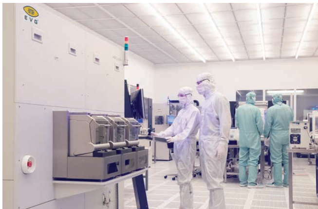
Cleanroom at EVG headquarters

EVGはこのような万全の体制でプロセス開発からパイロット生産の立ち上げに向けて、適切な技術的アドバイスやサポートを提供しております。