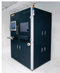
EVG*7200 全自動UV-NIL装置 200 mmまでの基板に対応