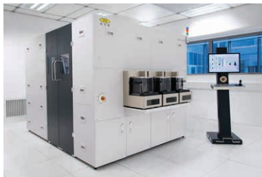
EVG* HERCULES* NIL 全自動SmartNIL* UV ナノインプリント装置 200 mmまでの基板に対応